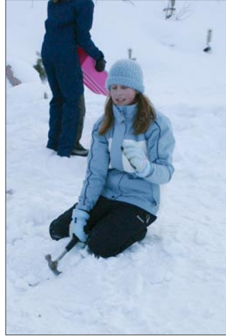
Kia Airolalta käy kätevästi lumen pehmittäminen vasaralla.