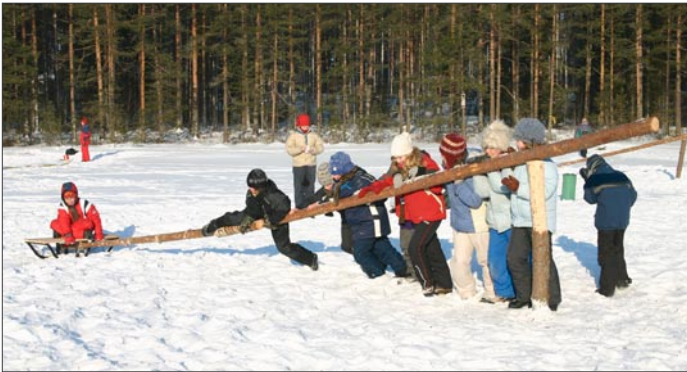
Heikompa voisi hirvittää.