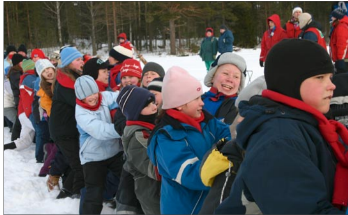
Köydenvedossa kunnia punnitaan.

Katapulttiammunnassa Hevonlinalaisilla oli paranneltavaa tarkkuuden kanssa. Ohi ammutuista lauka-