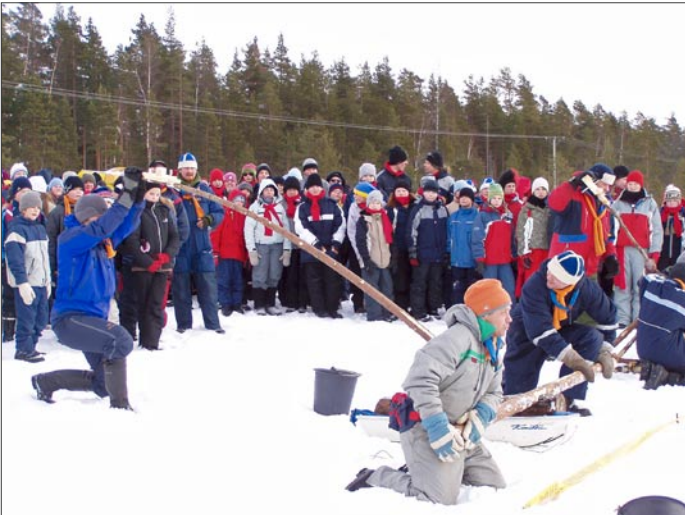
VarKkaansaarella oli pisin.